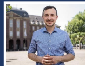
Paul Ziemiak MdB Bundesvorsitzender der Jungen Union Deutschlands